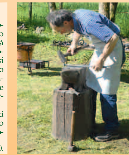
Terno A di Arrigoni a Palazzago (sopra).

duce opportunità innovative nell'utilizzo di materiali e tecnologie d'avanguardia. È l'antica strada che si congiunge con la nuova e documenta una vivacità economica in grado di sperimentare ulteriori proposte capaci di stare al passo con i tempi. Non è facile, ma gli artigiani ci provano in continuazione. Il lavoro rimane quale strumento di emancipazione, per la crescita personale, di progresso sociale e promozione di nuove opportunità, in vista di migliorare