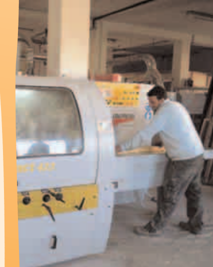
F.B. Serramenti Bugada. Valsecca (ai lati)

È un periodo molto faticoso per le imprese impegnate a resistere alla crisi. Non per questo siamo sfiduciati, perchè non c'è crisi che possa annullare il nostro essere artigiani o diminuire la comune passione per il lavoro. Proprio in questi momenti difficili dobbiamo reinventarci e innovare. Per anni abbiamo vissuto un'economia individualista. Oggi dobbiamo scoprire il grande valore economico e morale della coesione sociale, del mutuo sostegno e della cooperazione. Sono ingredienti irrinunciabili per il futuro delle nostre imprese. L'Associazione degli Imprenditori della valle intende promuovere questa dimensione sociale, per sostenere le piccole imprese e vincere insieme le sfide che un mercato in continuo subbuglio ci propone.